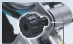
Pokrętko regulacji wysokości

3-stopniowa regulacja pozwala na dostosowanie urządzenia do wzrostu użytkownika (790 / 910 / 1020 mm)