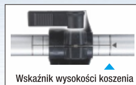
Wskaźnik wysokości koszenia